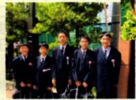
中学校入学式にて