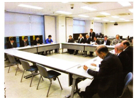
国土交通省への説明の様子

また、事業を実施する国土交通省荒川下流河川事務所を訪問し、「堀切地区まちづくり構想」の説明と協力の要請を行いました。地元選出の区議会議員にも「堀切地区まちづくり構想」の内容を改めて説明し、堀切地区のまちづくりへの協力を要請しました。