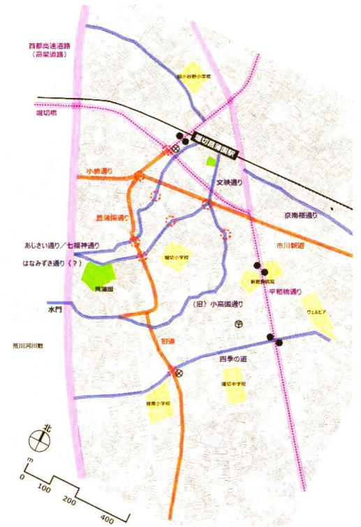
堀切のまちの姿を示す「基礎マップ」

来年度は、テーマ別マップ第1弾として、ビューポイントやレトロな界隈、緑が気持ち良い場所などを掲載した「堀切のお勧め見どころマップ」の作成を予定しています。また、このマップを配布・活用したイベントを実施するべく企画中です。