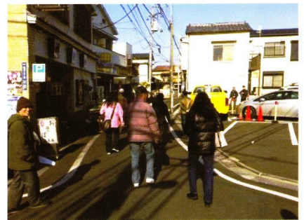
防災道路確認まちあるきの様子