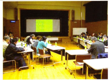
推進協議会の当日の様子