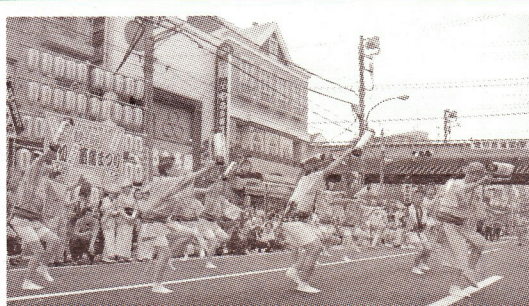
地元の「堀切あやめ連」の阿波踊り

6月中旬に見頃を迎えた花菖蒲。とり分け全国 的に有名な葛飾区の堀切菖蒲園では大勢の花見客 が訪れた。同時に6月1日、20日まで開催された 葛飾菖蒲まつりでは、12日の阿波踊りのパレード が例年より少なかったものの、会場の京成本線堀 切菖蒲園駅周辺には多くの見物客で溢れかえった。 また、堀切まちづくり推進協議会活性化部会と葛飾 区が検討して決定した、地元堀切の小学生の発案 による堀切の活性化イメージキャラクター「ほり きりん」のイラストがお目見え。6月11日と18日 に菖蒲まつり会場近くで行ったアンケート回答者 に先着順で「ほりきりん」の缶バッジを配った。